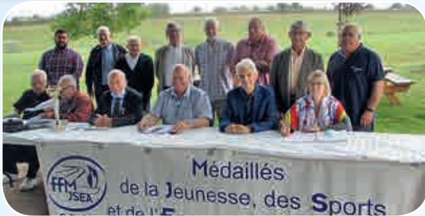
Le nouveau Conseil d'administration