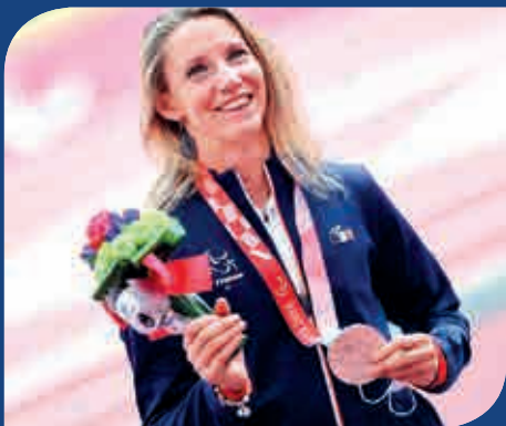
Marie-Amélie LE FUR Présidente et ambassadrice