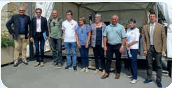
Les médaillés récompensés lors de l'AG du Jour