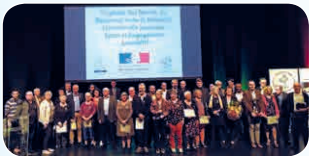
L'ensemble des médaillés et lauréats de Trophées 2020