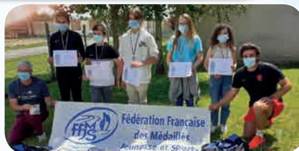
Collège Louis Anquetin à Etrépagny